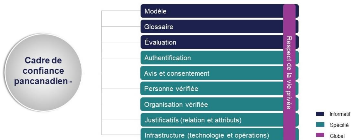
Figure 2. Composantes de l'ébauche du Cadre de confiance pancanadien